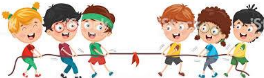
FIGURA 4.1: Representação da brincadeira Cabo de guerra 3

No planejamento, como dito no capítulo de metodologia, foi pensada a organização dos materiais necessários para o desenvolvimento das brincadeiras, assim providenciamos cadeiras, pano e corda. A figura 4.1 representa uma ilustração de uma das brincadeiras usada no processo de intervenção, ou seja, a brincadeira de cabo de guerra.