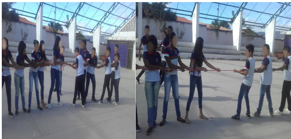
Figura 4.2: Imagens da brincadeira Cabo de Guerra

se mover atuou o atrito cinético, ou seja, havia movimento ou deslocamento. Na figura 4.2 podemos ver os estudantes realizando a brincadeira de cabo de guerra, após ter sido feito toda a explanação dos conteúdos necessários.