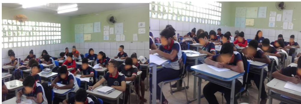
Figura 4.3 imagem dos alunos respondendo o questionário inicial

Na turma de 9º ano do Ensino Fundamental havia em 2018 34 alunos matriculados, mas no dia da aplicação do questionário inicial estavam presentes 33 alunos. É importante dizer que usamos a letra H para representar os meninos e M para representar as meninas, seguidos de uma sequência para identificar cada um sem revelar seus nomes. Dentro dos 33 estudantes que estavam no dia somente 18 responderam a primeira questão e os demais responderam que não sabiam ou deixaram em branco.