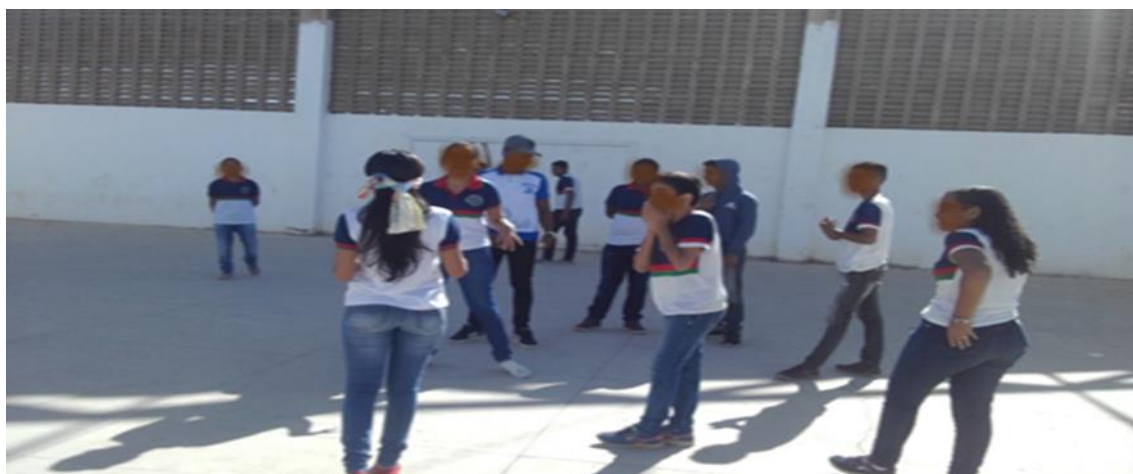
Figura 4.5: Realização da atividade 1 Cabra Cega.

Na figura 4.5 abaixo mostramos um recorte dos alunos realizando a primeira atividade proposta no espaço fora da sala de aula.