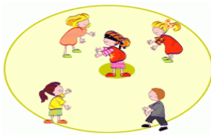
FIGURA 4.4: Representação da brincadeira Cabra Cega 5 .

Na figura 4.5 abaixo mostramos um recorte dos alunos realizando a primeira atividade proposta no espaço fora da sala de aula.