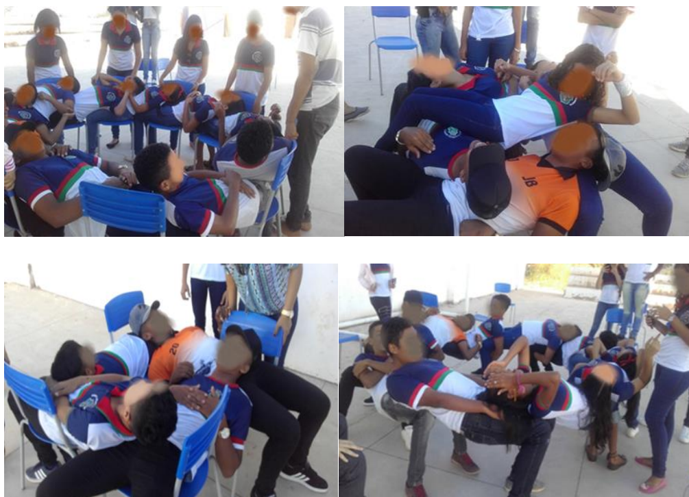
Figura 4.6: Brincadeira da Cadeira Humana

As figuras 4.6 abaixo mostramos um momento de interações com os estudantes.